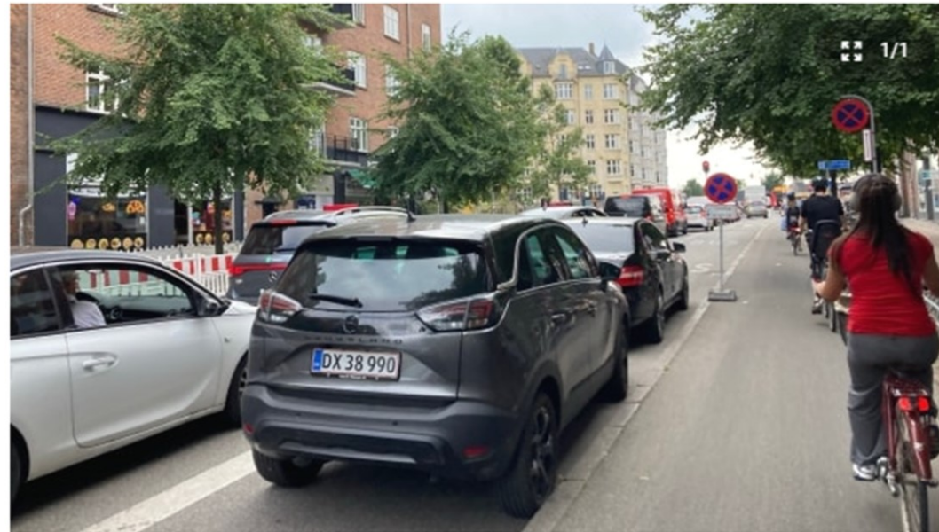
Københavns Kommune mener, at man nu har løst problemerne med vejarbejdet.