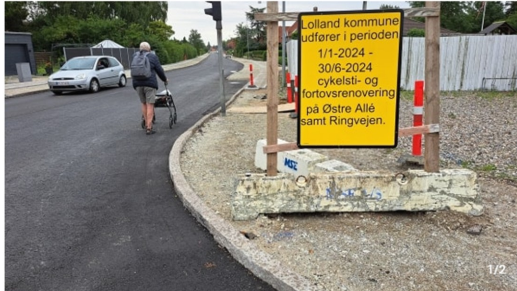
Tidsplanen kom ikke til at holde. Ikke mindst de gående glæder sig til, at arbejdet afsluttes.