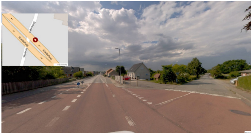
Ebeltoftevej 53, 8544 Mørke

Eksempler på vejafmærkning på rød kørebanebelægning ved statsvejene R21 og R15