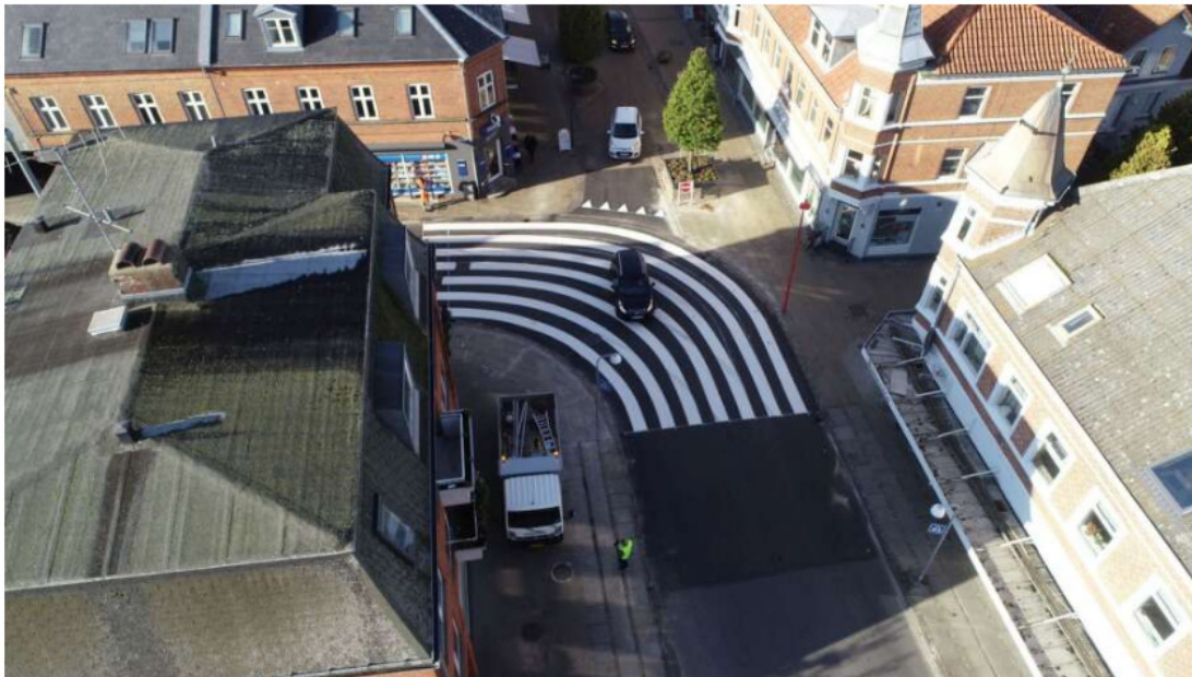
Den flot buede fodgængerovergang er her set lidt fra oven. Den skal give fodgængerne tryghed på et trafikeret sted – og den trods sin buede form er lavet lige efter bogen.

Udgivet: 12. oktober 2019, 10.24 | Læsetid: 2 minutter