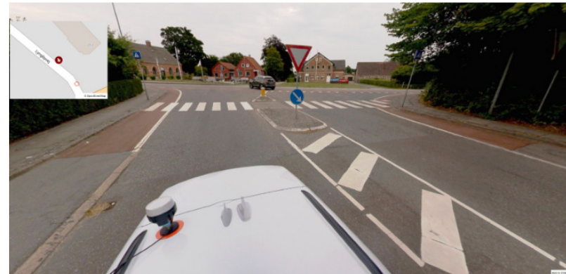
Århusvej 252, Trustrup, 8570 Trustrup

Dokument dannet: 22-11-2024 10:20:31 Dato for fotografering: 31-07-2022